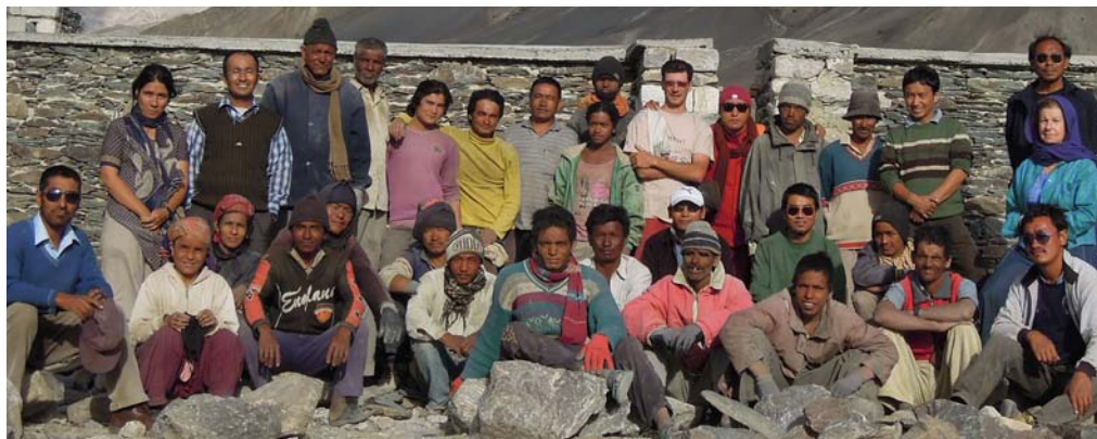
Équipe de Costruzione NBP - Settembre 2012

Buona Pasqua a tutti! Per il bureau - Eliane SERVEYRE