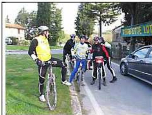
con il sindaco di Monteriggioni