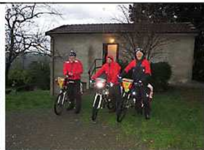
Aulla - partenza