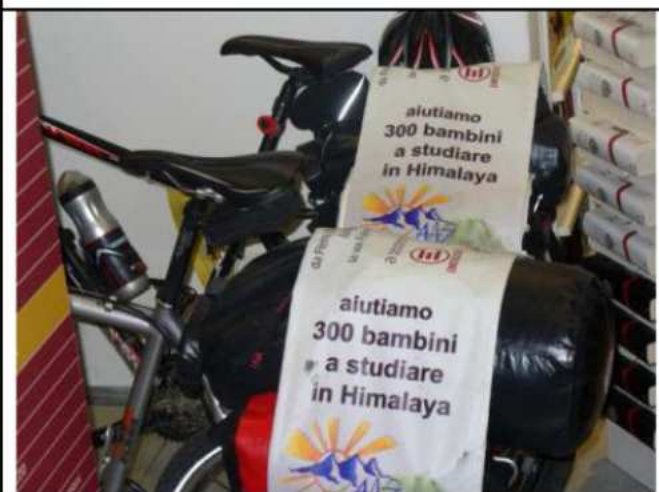
a sostegno di ....