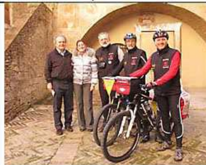
con l'assessore di S. Gimignano