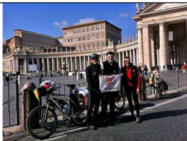
Roma in piazza S. Pietro – ore 13.42