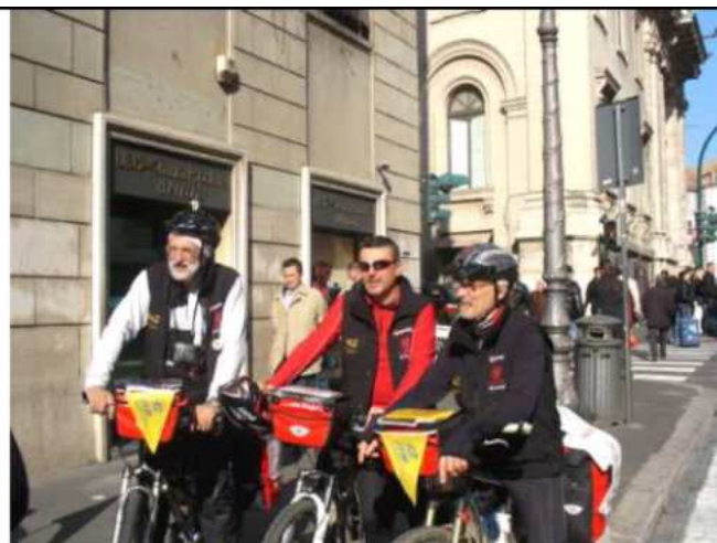
Roma - in via Nazionale