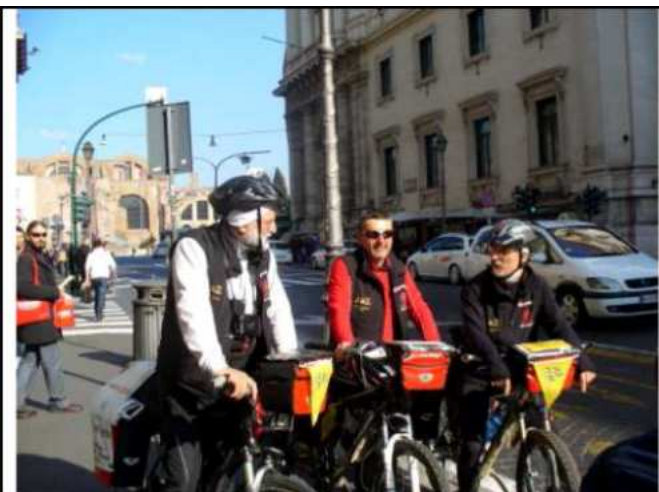
Roma - in via Nazionale