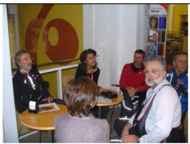
libreria MelBook- con gli amici di Emergency