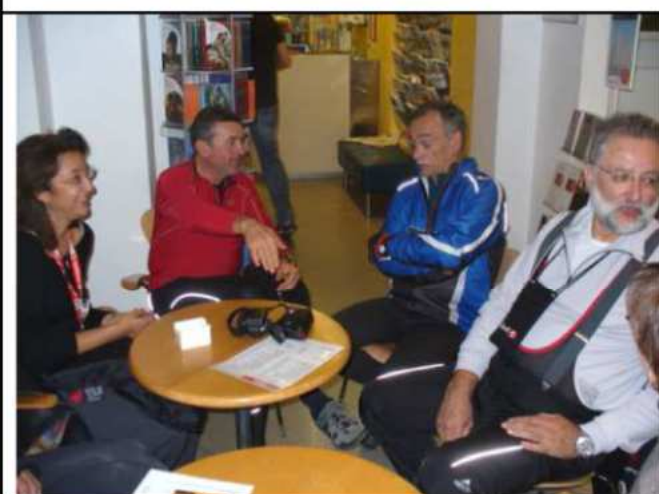
Roma -con gli amici di Emergency