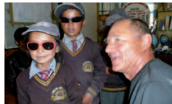
La distribution de lunettes de soleil