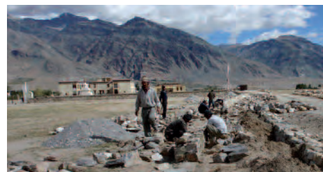
« Les travaux du mur d'enceinte ont enfin démarré »

Le coût global de la construction s'élèvera à 1 817 000 rps soit sur la base de 55 rps un coût de 33.036 € . Les travaux ont commencé à la mi-août et s'étaleront sur deux ans.