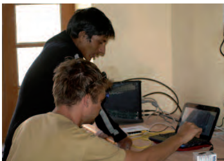
L'abonnement ne prévoit que 5 ordinateurs connectés en même temps