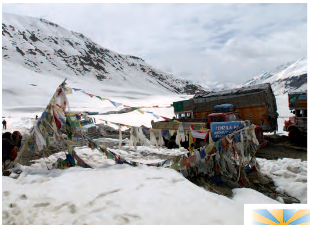
"En juin, le Pensila se franchissait entre deux murs de neige"