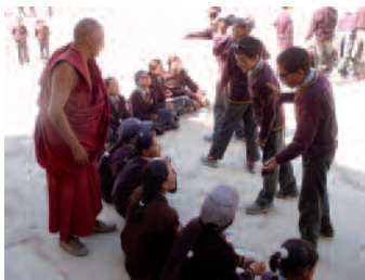
Enseignement du "debate" à l'école