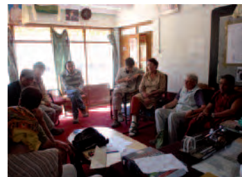
Une réunion de travail à l'école