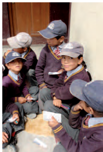
Les filles à l'école

Aujourd'hui, le nombre de filles à l'école est inférieur au nombre de garçons. La proportion est de 42 % de filles, 58 % de garçons. C'est pourquoi, nous avons demandé au Managing Committee, lorsque l'admission est tirée au sort, de prévoir une « boîte » pour les garçons et une « boîte pour les filles ». Cela devrait permettre d'augmenter le nombre de filles à l'école.