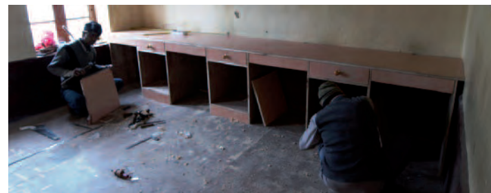
Le charpentier fabrique l'installation qui doit recevoir les "computers"