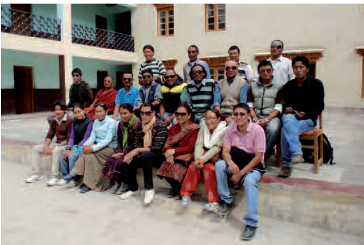
Geshey, professeurs et staff de l'école